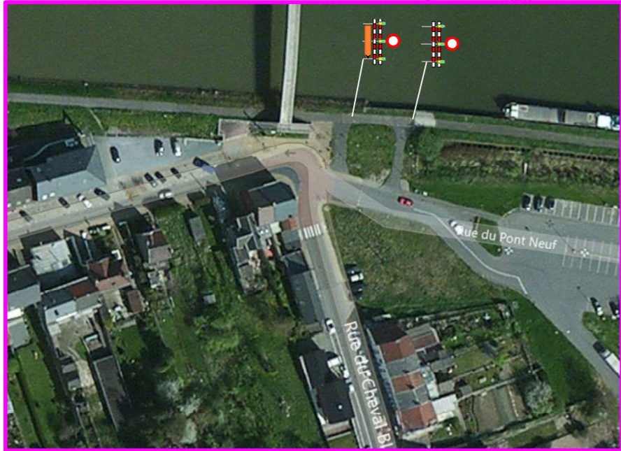
Pont a celles